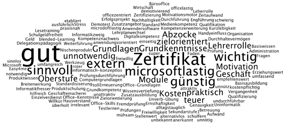
Abbildung 2: Wortwolke der Stichworte